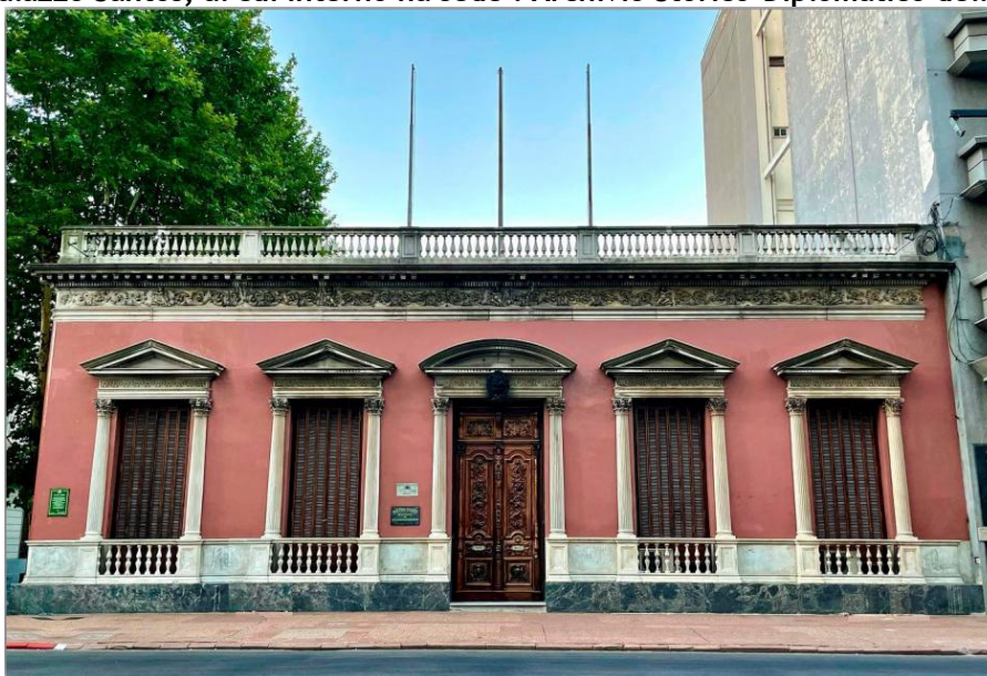
Fig. 1 - Palazzo Santos, al cui interno ha sede l'Archivio Storico-Diplomatico dell'Uruguay