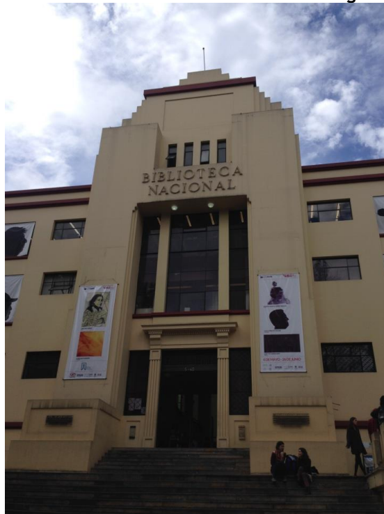
Fig. 2 - Ingresso della Biblioteca Nazionale della Colombia a Bogotá