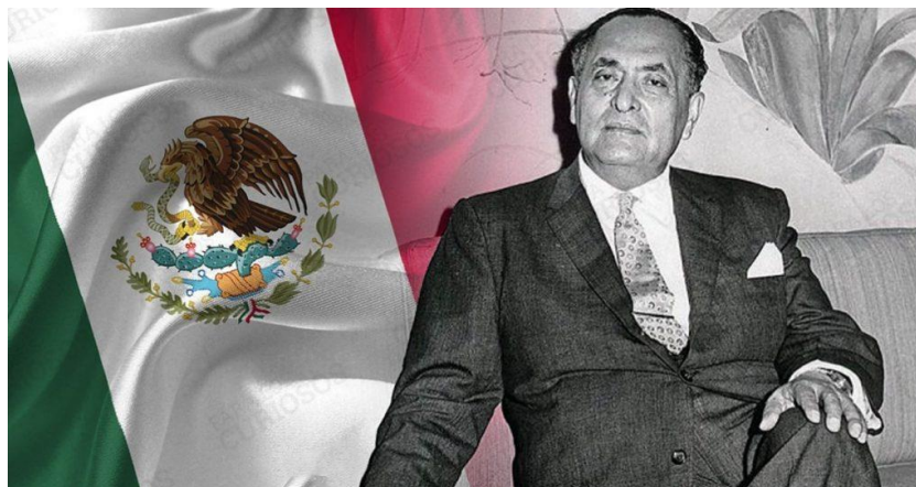
Diplomático Gilberto Bosques Saldívar