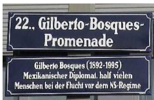
Viena, calle Gilberto Bosques, Distrito 22 (Austria).