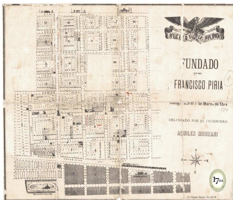
Plano del Recreo de Las Piedras 1874 15

El trienio 1861-1863 será escenario de una serie de enfrentamientos por el control de la Universidad de la República, que irá consolidando la secularización del estado uruguayo a partir del año 1870, el mismo año en que Rafael Cadorna abría una brecha a la unificación italiana y el Comitato Masónico del Río de la Plata 14 , implantaba Logias italianas en Montevideo y Buenos Aires. El avance europeizador suramericano, habilitaba en Montevideo, a José Pedro Varela, a poner en marcha la reforma de la enseñanza, que transformó a la escuela pública uruguaya en laica, mixta, gratuita y obligatoria , en una república con 80% de analfabetos.