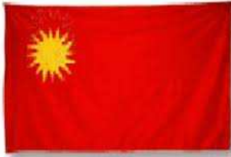
Club Rivera 32

LAS BANDERAS. Sólo dos banderas iban con los manifestantes: la del Club Rivera, roja con el Sol de Oro en un ángulo y la de los garibaldinos. Antes de emprenderse la marcha se colocaron juntos los dos abanderados en el estribo de uno de los coches delanteros y así fueron todo el viaje los estandartes. (...).