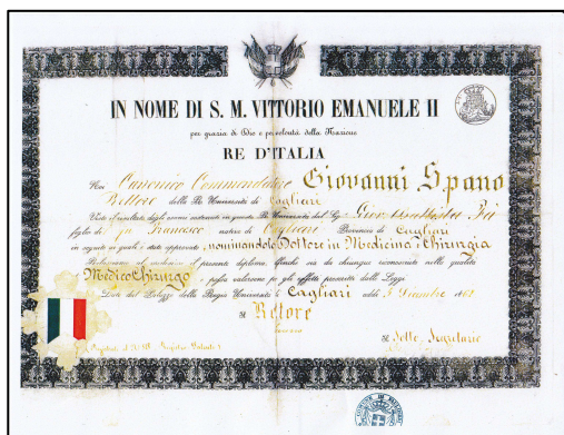
Diploma de Giovanni Battista Fá 7

Pero ¿Quién era el Dr. Fá? ¿Por qué emigró de su Cerdeña natal al Río de la Plata? ¿Por qué, radicado en Montevideo, decide trasladarse hacia el interior del país junto a su familia? Radicado en Las Piedras, ¿Qué lo decide nuevamente a trasladarse a Sauce? Algunas de estas interrogantes podremos responder, otras, lograremos al menos contextualizarlas, manteniendo por otra parte, algunas de ellas, en el ámbito de la hipótesis.