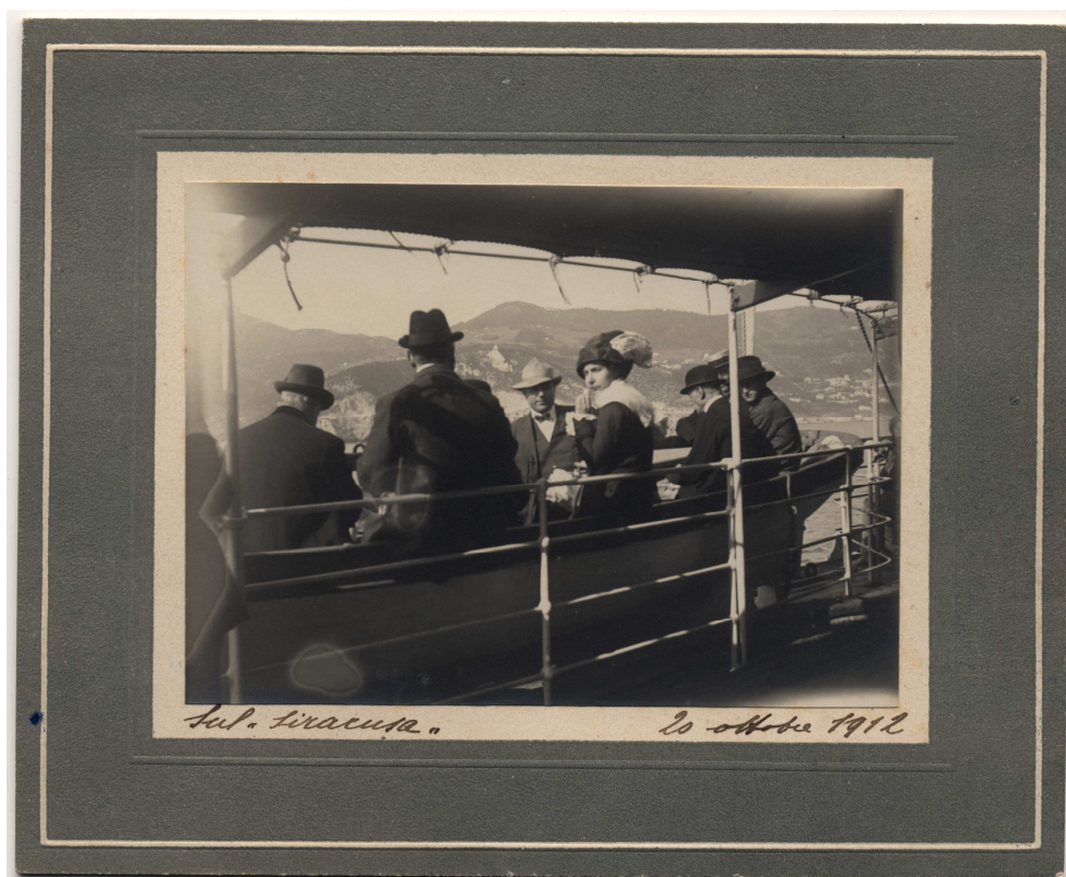
Figura 3 - Foto sul Siracusa (1912).