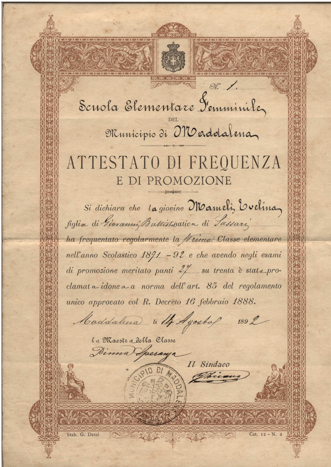
Figura 5 - Licenza elementare (1892).