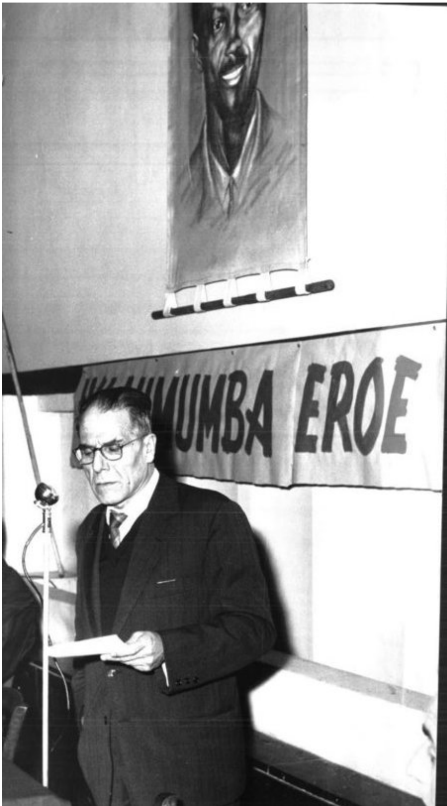
Figura 5 - Fonte: ARCHIVIO DE «L'UNITÀ», Roma.