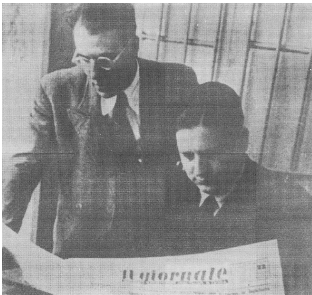
Figura 1 - Velio Spano con Giorgio Amendola.

L'inizio della guerra determinò la chiusura di tutti i giornali in Tunisia - sia fascisti che antifascisti - e i redattori e giornalisti passarono anni difficilissimi, fra processi, condanne a morte in contumacia, fughe, campi di concentramento e persecuzioni varie 19 .