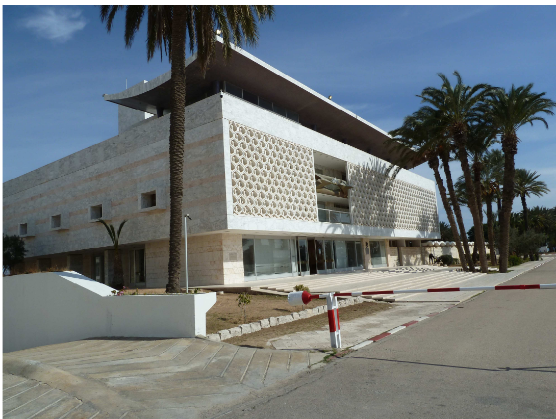
Figura 4 - Il Museo Bouguiba di Monastir recentemente riaperto al pubblico. (Foto del 19 marzo 2016).