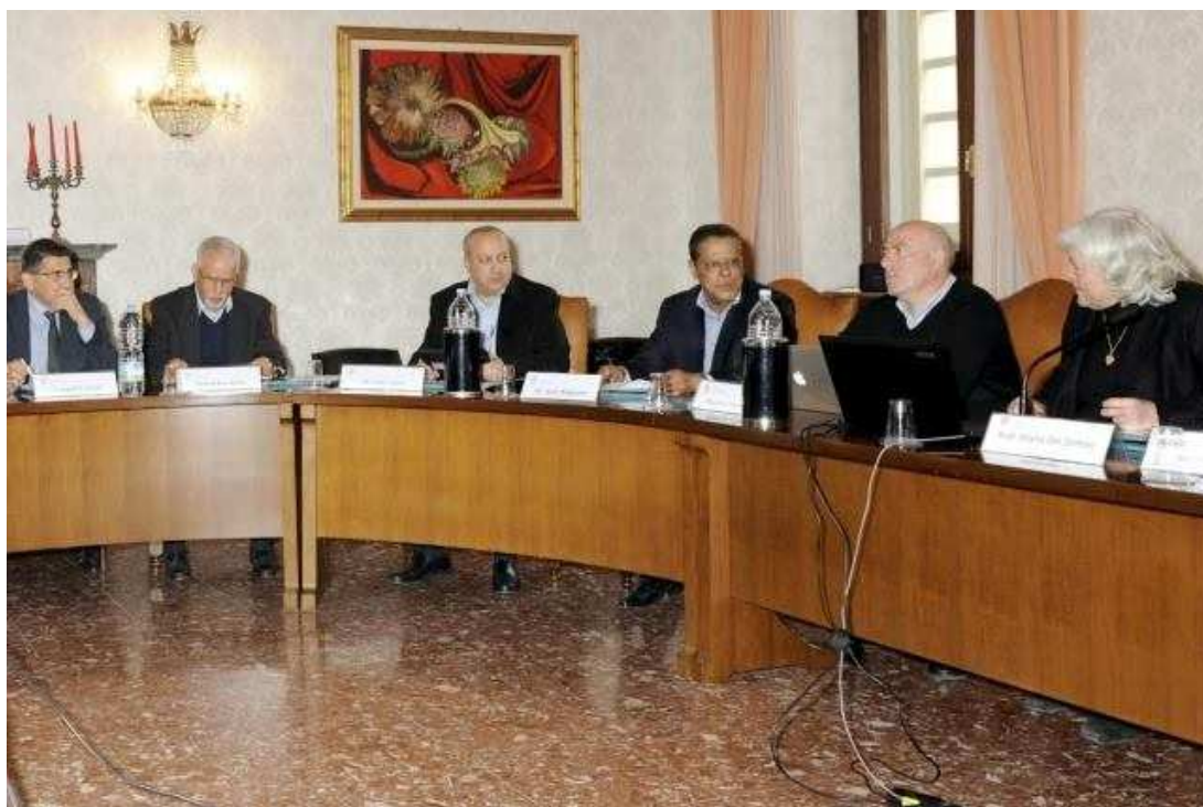
Figura 3 - L'incontro della delegazione tunisina presieduta dai Rettori di Tunisi e Cartagine con i Rettori di Cagliari e Sassari. (Cagliari, 29 gennaio 2016).