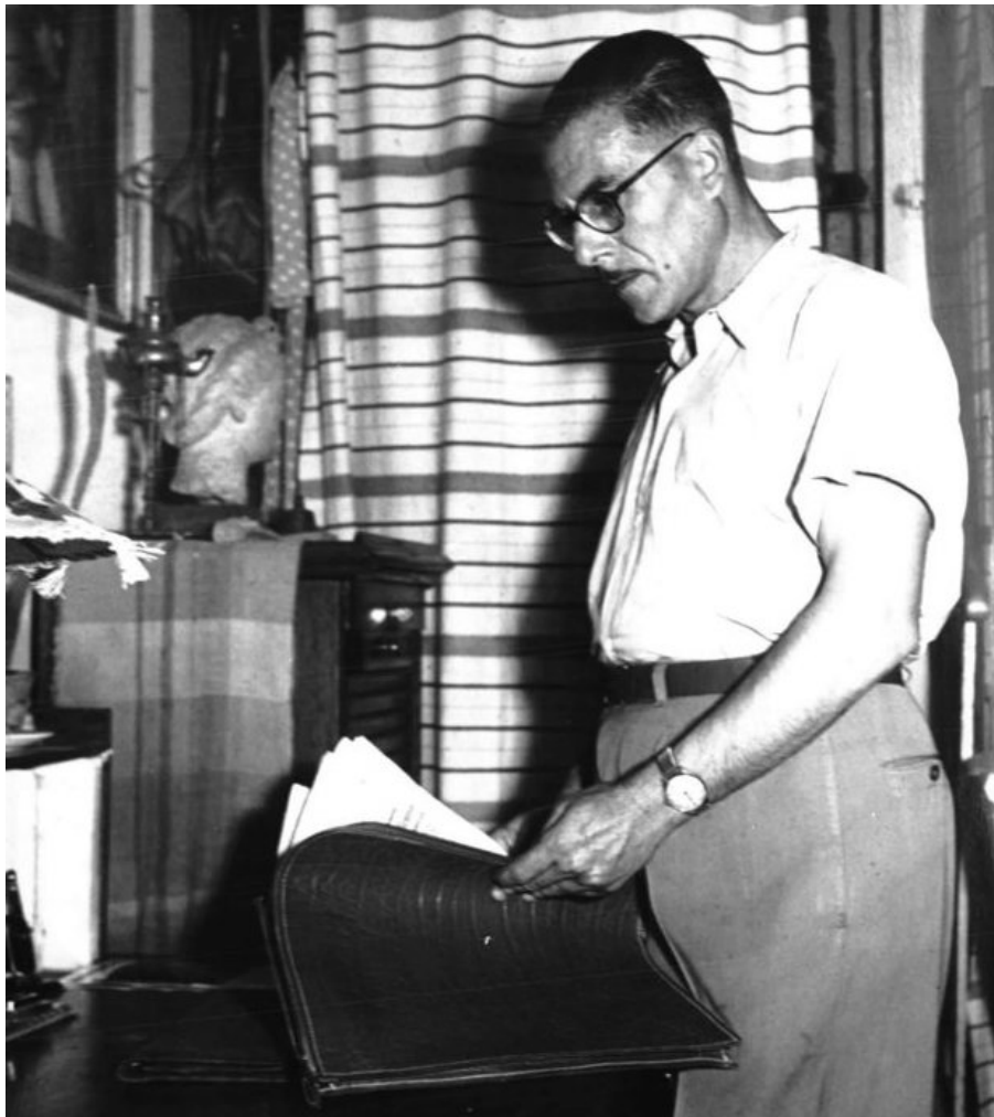
Figura 3 - Fonte: ARCHIVIO DE «L'UNITÀ», Roma.

A Napoli, dal dicembre del 1943 assume la direzione dell'edizione meridionale de «L'Unità». Nel luglio del 1944 entra a far parte della direzione provvisoria del PCI nell'Italia liberata e da quel mese dirige, sino al giugno del 1946, l'edizione romana de «L'Unità». Membro della direzione provvisoria nazionale (costituita, l'8 agosto 1945, dai due gruppi dirigenti di Roma e Milano) e della Consulta Nazionale per la Costituente, fu in seguito sottosegretario all'agricoltura nel Governo De Gasperi (dicembre 1945 - luglio 1946). Al V congresso del PCI (dicembre 1945) venne eletto nel Comitato Centrale e nella direzione, e vi rimase fino al IX congresso.