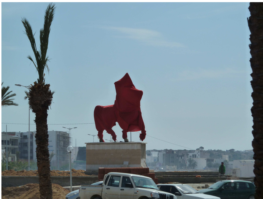
Figura 5 - Monastir. Il monumento equestre di Bourguiba restaurato prima di essere di nuovo inaugurato alla vigilia dell'anniversario della festa per l'indipendenza nazionale. (19 marzo 2016).