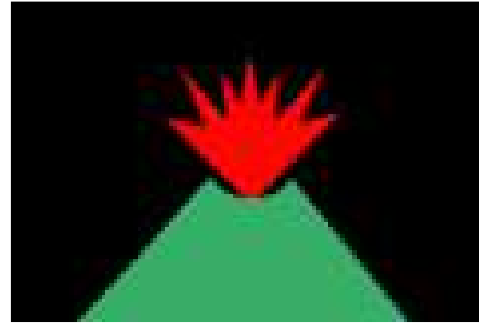
Garibaldinos de Montevideo 33

EN LAS PIEDRAS. Desde antes de llegar el tren a la estación de las Piedras, rebosaba la concurrencia, con una banda de música que en el momento de enfrentar la locomotora al andén atacó los primeros compases de la marcha de Garibaldi. Al frente de la gente que aguardaba el convoy estaba el Dr. FA , presidiendo una numerosa Comisión Local.